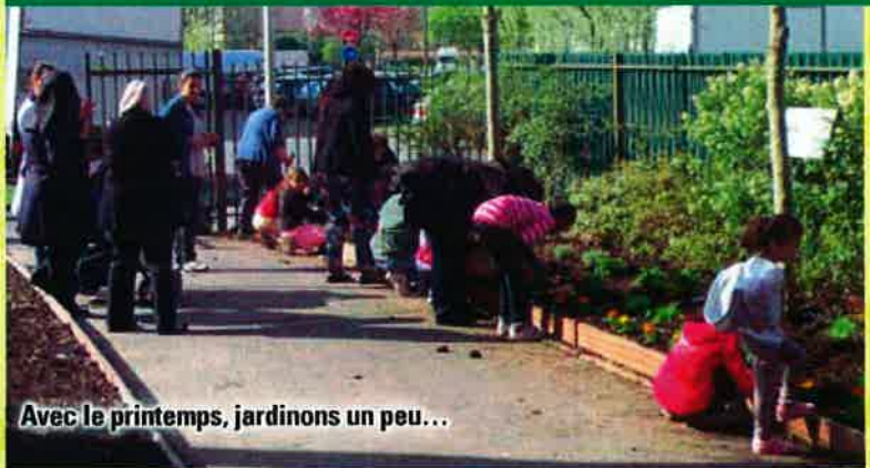
Avec le printemps, jardinons un peu...