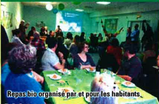
Repas bio organisé par et pour les habitants.